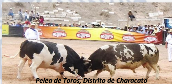
Pelea de Toros, Distrito de Characato

11:40 a.m.: Aproximadamente retorno a la ciudad de Arequipa.