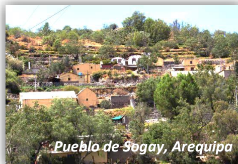
Pueblo de Sogay, Arequipa

Sogay este es un pueblo restaurado donde uno puede pensar que el tiempo se ha detenido ya que se han restaurado la mayoría de casas coloniales, debido a su ubicación estratégica (Sogay está en medio de los pueblos tradicionales) fue un corregimiento muy importante en la época Colonial, las casas en su mayoría datan de 1880 hasta 1940, además se puede apreciar su paisaje agrícola.